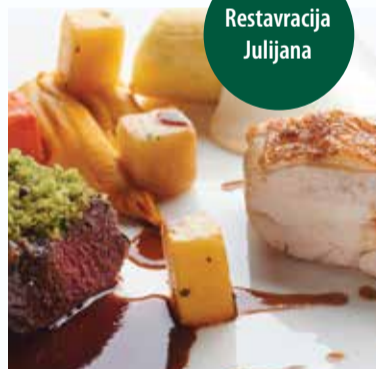
Meni »Gorenjski izbor« v Grand Hotelu Toplice | The "Gorenjska region selection" menu - Grand Hotel Toplice