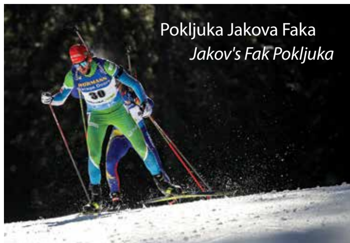
Pokljuka Jakova Faka Jakov's Fak Pokljuka

... Kjer se zima ne konča. | ... Where winter lasts longer.