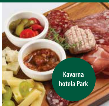
Gorenjske mesnine in lokalni siri | Gorenjska meat products and local cheese