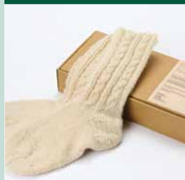
Pletene nogavice iz 100 % naravne ovčje volne | 100% natural sheep wool knitted socks