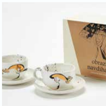
Linija keramičnih izdelkov: Poveživa se | Line of ceramic products: Let's connect