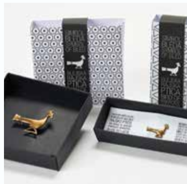
Linija izdelkov: Blejska Rajska ptica | Product line: Bled's bird of paradise