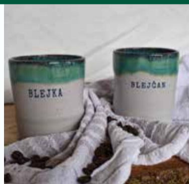
Blejski parčki | Bled pairs