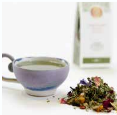
Darilni paket mešanega zeliščnega čaja z ročno izdelano skodelico | A gift package containing a herbal tea blend with a hand-made mug