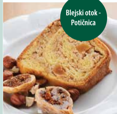
Lešnikova potica s figami z Blejskega otoka | Hazelnut "potica" cake with figs from Bled Island