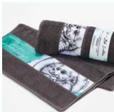
A. Rikli: Kolekcija Voda-zrak-svetloba | A. Rikli: Water-air-light collection