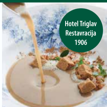
Juha 1906 | 1906 soup