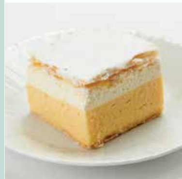
Blejska kremna rezina | Bled cream cake