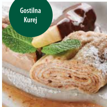
Prgini štruklji | Pear-pomace rolls