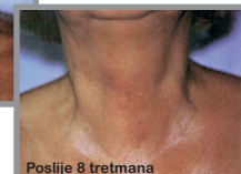
Poslije 8 tretmana